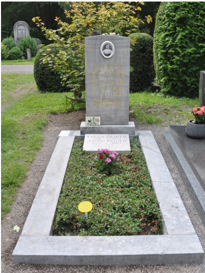
Grab von Albert Richter auf dem Friedhof Melaten in Köln nach der Restaurierung (2025) Fotograf/Urheber: Nicola