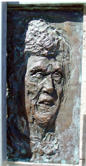
Das stilisierte Portraitrelief der Glasstele zu Ehren von Freya Gräfin von Moltke, geb. Deichmann (2020).