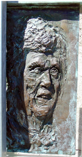
Das stilisierte Portraitrelief der Glasstele zu Ehren von Freya Gräfin von Moltke, geb. Deichmann (2020).