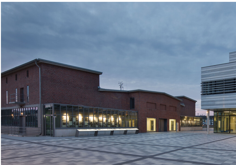
Die Großviehmarkthalle des städtischen Schlachthofs in Düsseldorf-Derendorf (2020), im Eingangsbereich befindet sich heute der Erinnerungsort Alter Schlachthof.