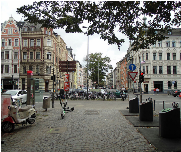
Blick in Richtung Neustadt-Süd auf der Moltkestraße in Köln (2020)