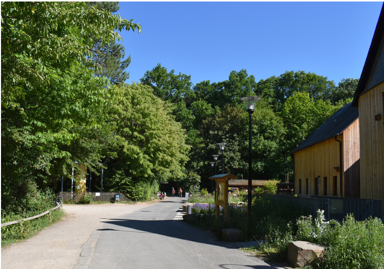
Straße zum Eingang des Wildparks Waldau bei Bonn, rechts das Haus der Natur (2020).