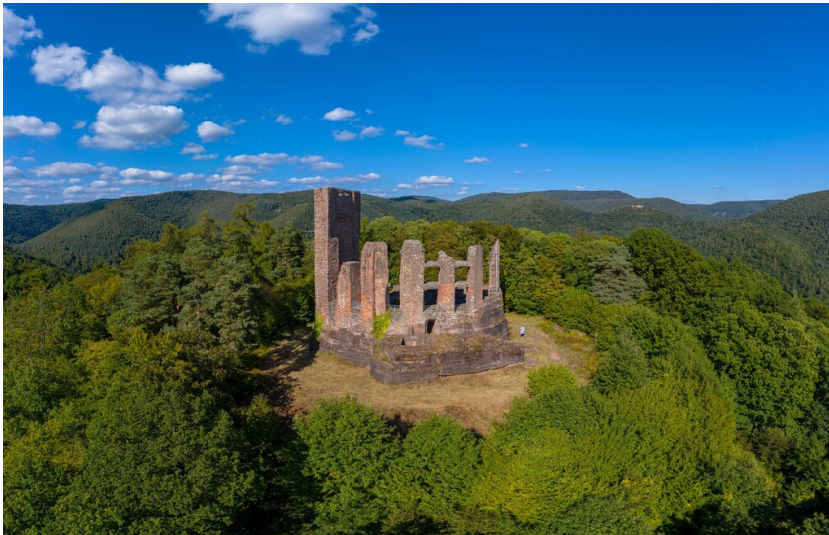
Luftaufnahme der Ramburg