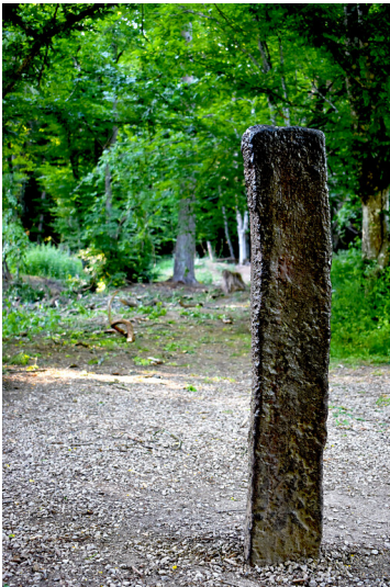
Der Eiserner Mann in der Waldville bei Dünstekoven (2020)