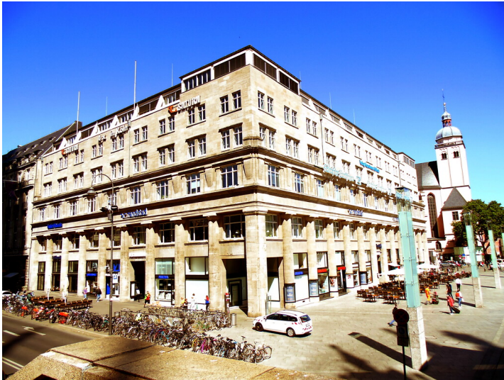
Das Deichmannhaus in der Trankgasse in der Kölner Altstadt-Nord (2020).