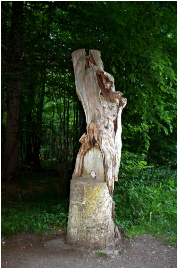
Der Kamelleboom in der Ville bei Bornheim (2020)