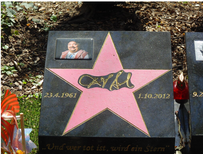
Der Grabstein des Schauspielers und Komikers Dirk Bach auf dem Melatenfriedhof in Köln-Lindenthal (2020).