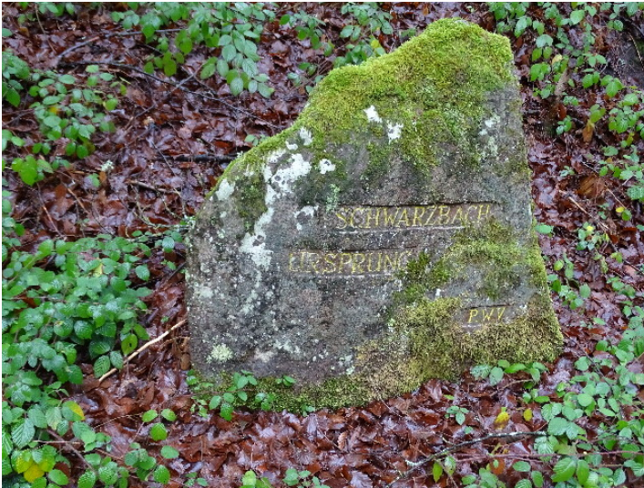
Ritterstein Nr. 245 Schwarzbach Ursprung südwestlich von Johanniskreuz (2018)