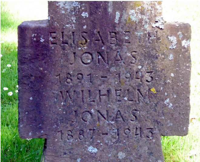
Ein steinernes Grabkreuz auf dem Kriegsgräberfeld Nr. 90 auf dem Kölner Friedhof Melaten (2020).