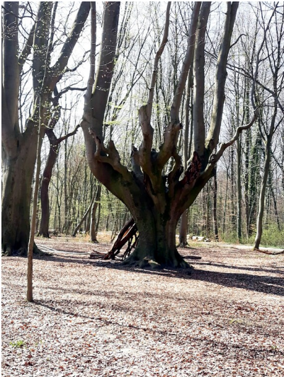
Kopfbuche im Kottenforst in der Nähe der Waldau (2019)