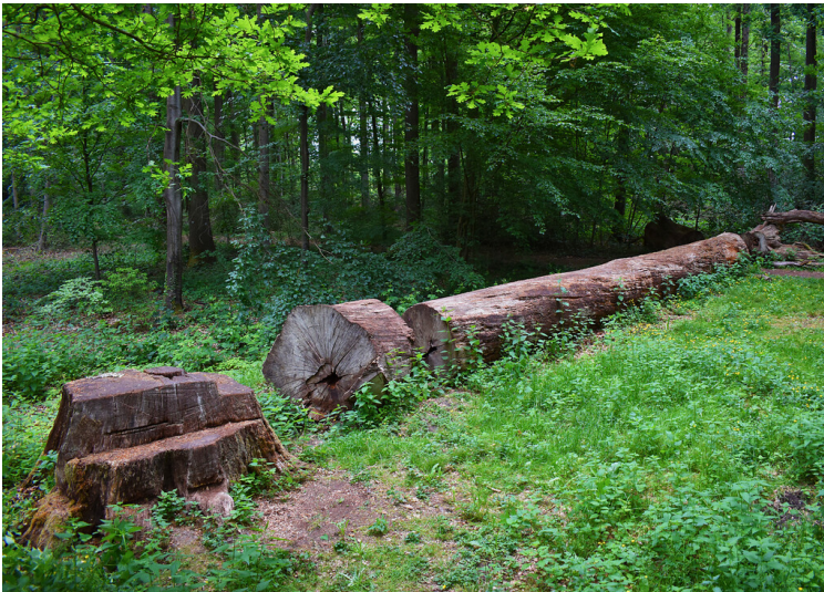
Schnacke Eiche (2020)