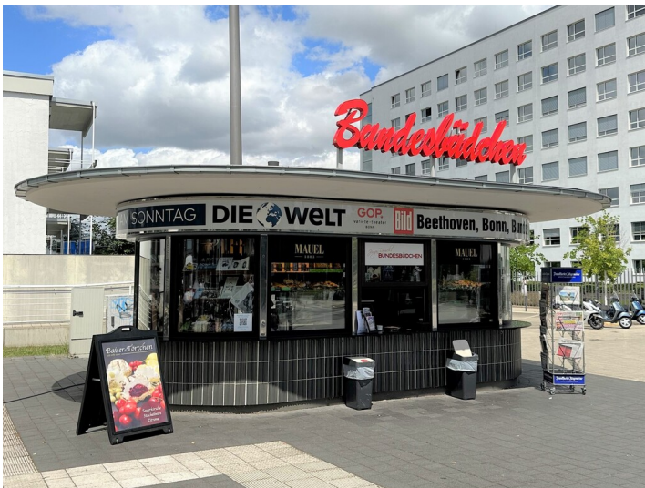
Das Bundesbüdchen an seinem neuen Standort auf dem Platz der Vereinten Nationen in Bonn (2023).