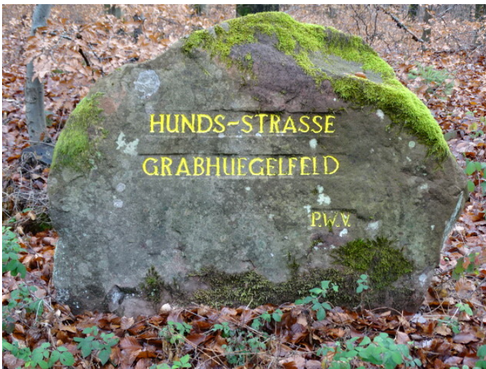
Ritterstein Nr. 244 Hunds-Strasse Grabhuegelfeld östlich von Heltersberg an der L 499 (2018)