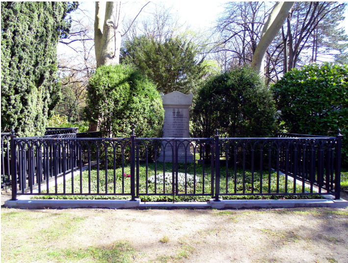
Die Grabstätte von Mitgliedern der Familie Du Mont auf dem Kölner Friedhof Melaten (2020).