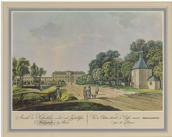
Historische Ansicht des Jagdschlosses Herzogsfreude Fotograf/Urheber: Andreas Johann Ziegler ; Laurenz Janscha