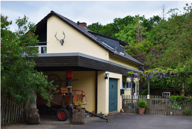
Forsthaus Venne (2020)