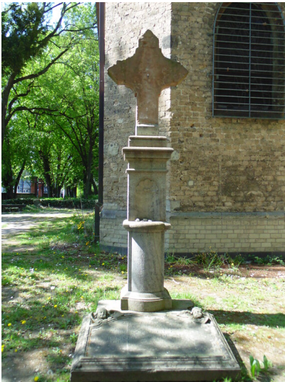
Denkmal für die mehr als 100 Toten einer Kölner Hochzeitsgesellschaft auf dem Friedhof Melaten (2020).