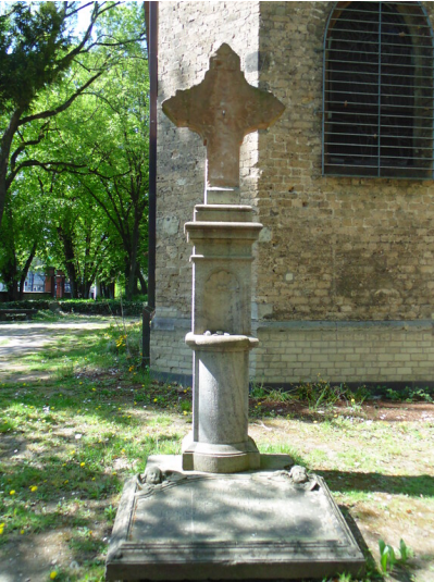
Denkmal für die mehr als 100 Toten einer Kölner Hochzeitsgesellschaft auf dem Friedhof Melaten (2020).