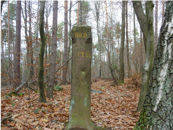
Ritterstein Nr. 25 Bild 1756 westlich von Dörrenbach (2012)