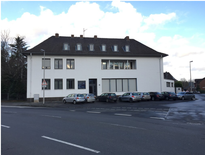
Ansicht der ehemaligen Zentralbank in Jülich. Heute befindet sich in dem Gebäude eine Anwaltskanzlei (2020).