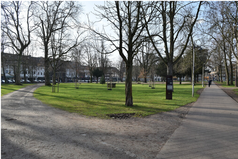
Der Schloßplatz in Jülich (2020).