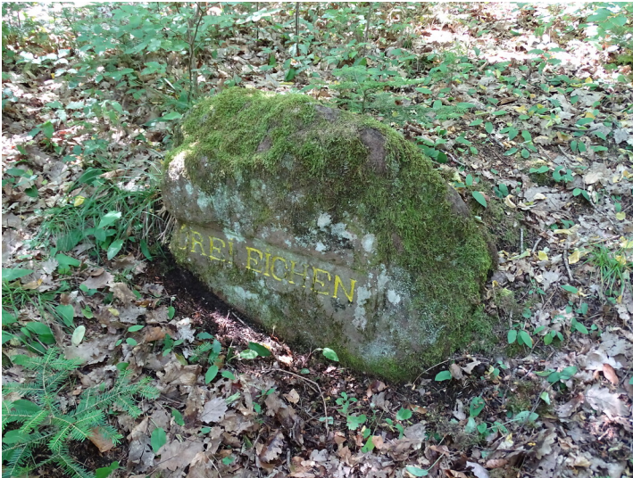
Ritterstein Nr. 21 Drei Eichen südwestlich von Böllenborn (2020)