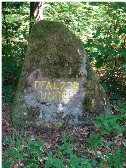
Ritterstein Nr. 19 Pfälzer Unger nördlich von Bobenthal (2020)