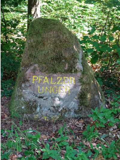
Ritterstein Nr. 19 Pfälzer Unger nördlich von Bobenthal (2020)