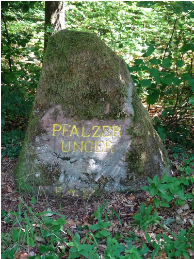
Ritterstein Nr. 19 Pfälzer Unger nördlich von Bobenthal (2020)