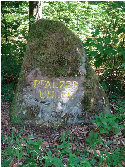
Ritterstein Nr. 19 Pfälzer Unger nördlich von Bobenthal (2020)