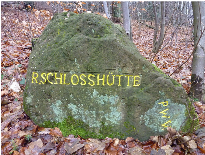
Ritterstein Nr. 15 R. Schlosshütte nördlich der Burgruine Guttenberg (2012)