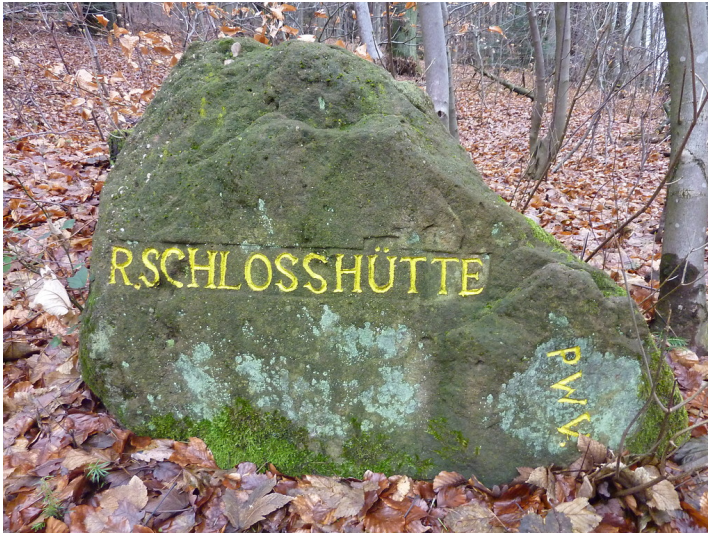
Ritterstein Nr. 15 R. Schlosshütte nördlich der Burgruine Guttenberg (2012)