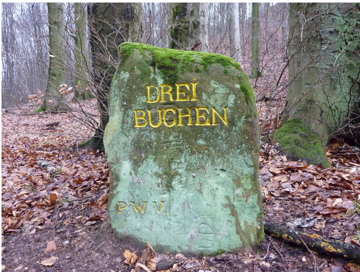
Ritterstein Nr. 14 Drei Buchen an der Burgruine Guttenberg (2012)