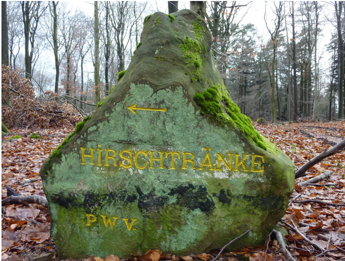
Ritterstein Nr. 13 Hirschtränke nördlich vom Reisberg (2012)