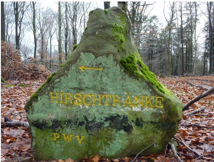
Ritterstein Nr. 13 Hirschtränke nördlich vom Reisberg (2012)