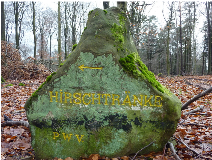
Ritterstein Nr. 13 Hirschtränke nördlich vom Reisberg (2012)