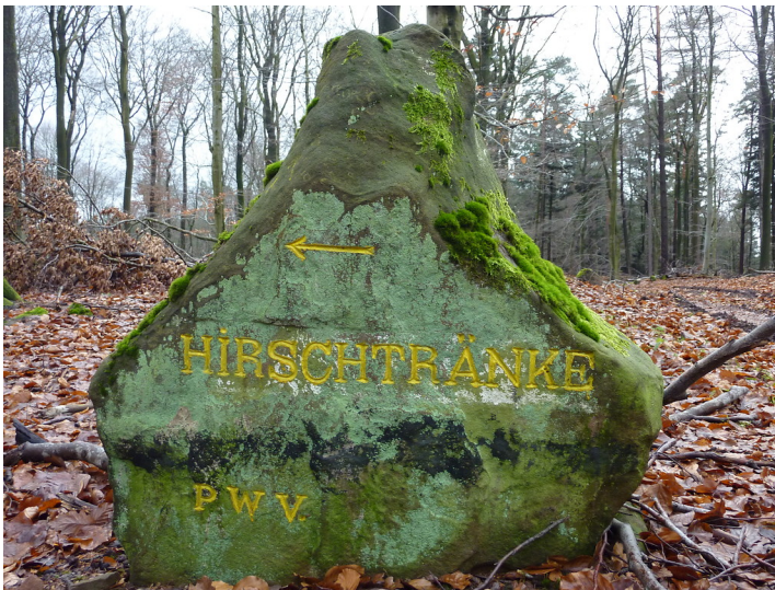
Ritterstein Nr. 13 Hirschtränke nördlich vom Reisberg (2012)