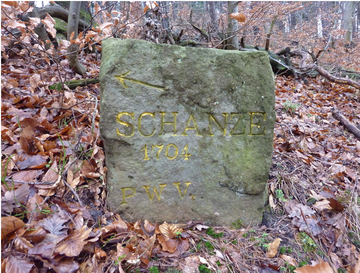
Ritterstein Nr. 12 Schanze 1704 südlich von der Burgruine Guttenberg (2012)