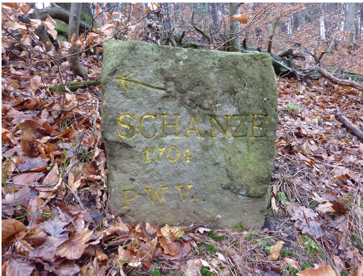
Ritterstein Nr. 12 Schanze 1704 südlich von der Burgruine Guttenberg (2012)