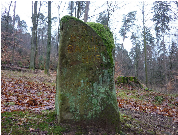
Ritterstein Nr. 11 R. Buchbacherhof südwestlich von der Burgruine Guttenberg (2012)