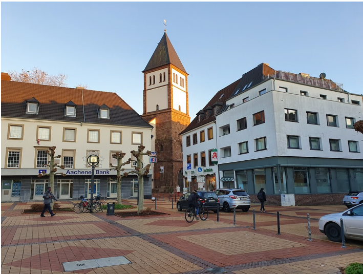
Ansicht des Marktplatzes in Jülich mit Kirchturm der Propsteikirche St. Mariä Himmelfahrt im Hintergrund (2019).