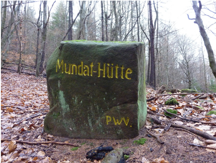
Ritterstein Nr. 8 Mundat-Hütte östlich von Bobenthal (2012)