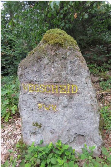
Ritterstein Nr. 7 Wegscheid nordwestlich von Schweigen-Rechtenbach (2018)