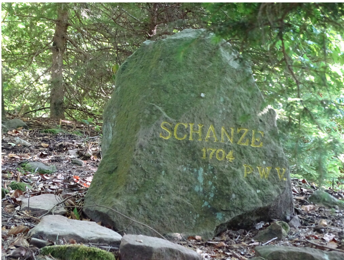
Ritterstein Nr. 2 Schanze 1704 am Probstberg bei Bobenthal (2020)