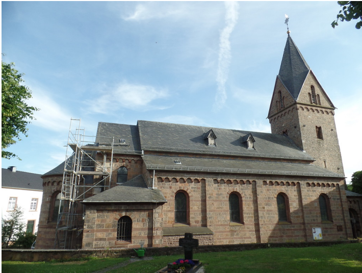
Kirche St. Georg (2018)