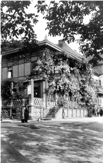
Kontorgebäude Mosel in der Rheinuferstraße 54 in Kamp-Bornhofen (spätes 19./frühes 20. Jahrhundert)

Schlagwörter: Bürogebäude Fachsicht(en): Landeskunde Gemeinde(n): Kamp-Bornhofen Kreis(e): Rhein-Lahn-Kreis Bundesland: Rheinland-Pfalz