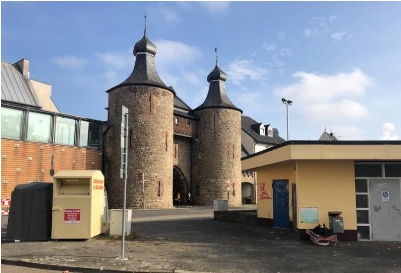
Der Walramplatz mit Blick auf den Hexenturm in Jülich (2019).