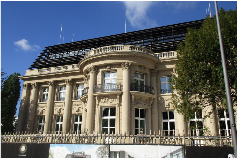
Blick auf die Vorderfront des Palais du Rhin, auch Rheinpalast oder Villa Oppenheim genannt, in Köln-Bayenthal (2020).