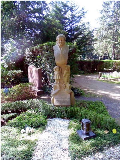
Gedenkskulptur für Johann Christoph Winters auf dem Kölner Friedhof Melaten (2020).