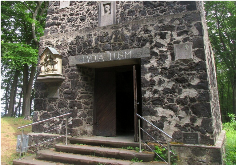
Der Eingang zum Lydiaturm bei Wassenach am Laacher See mit dort angebrachten Gedenktafeln (2020).