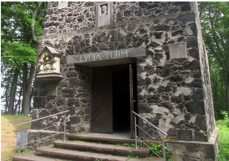
Der Eingang zum Lydiaturm bei Wassenach am Laacher See mit dort angebrachten Gedenktafeln (2020).