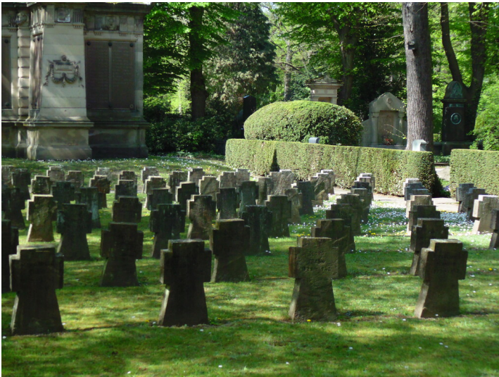
Gräberreihen des Zweiten Weltkriegs auf dem Kriegsgräberfeld V1 auf dem Melatenfriedhof in Köln-Lindenthal. Im Hintergrund ist das Kriegerdenkmal und Soldaten-Grabmal von 1870/71 zu sehen (2020)