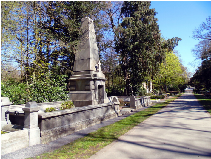
Grabstätte der Familie Deichmann auf der so genannten "Millionenallee" auf dem Melatenfriedhof in Köln-Lindenthal mit Blick nach Osten (2020).