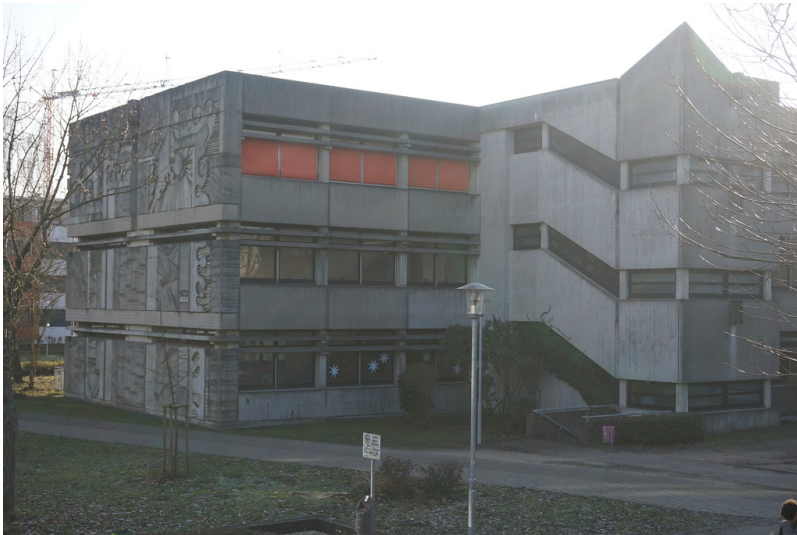
Europagymnasium Wörth am Rhein (2020)