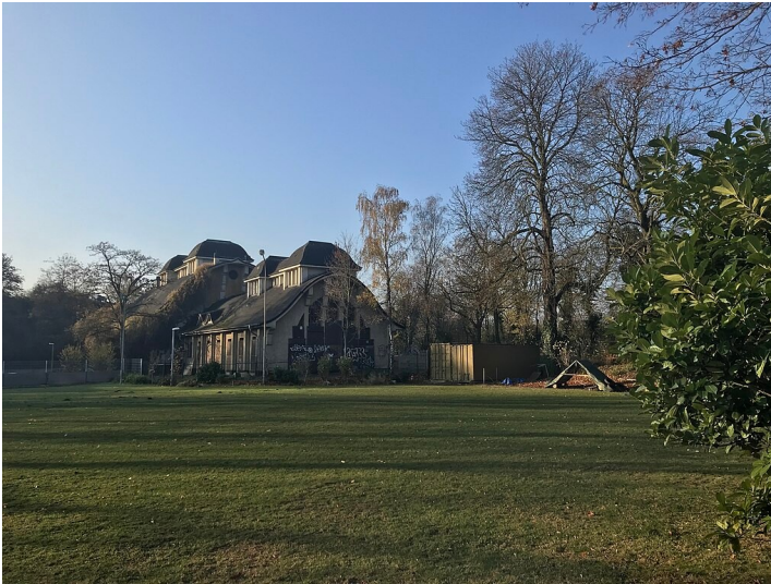
Das historische Klärwerk in Uerdingen, heute "Er-Klärwerk Krefeld" (2018).